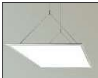
70033 SUSP WIRE PANELED