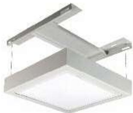
Sistema rapido di installazione dell'accessorio Cornice plafone

PaneLED SOSTITUISCE APPARECCHI A SORGENTE FLUORESCENTE DA 4x18W e 2x36W